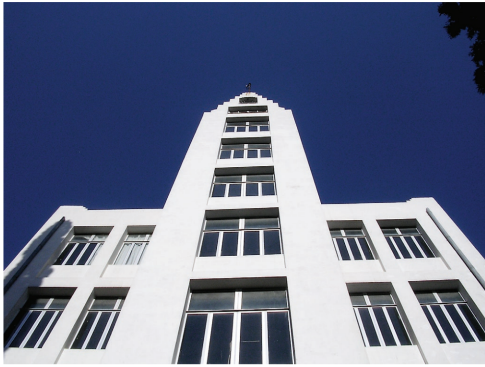
La façade de la maison située près du Lycée français.

L'homme était un illuminé, dans le sens le plus noble. À la fois impatient, pressé de faire, et serein devant l'éternité. Les pieds sur terre, la tête dans les nuages, décidé à décrocher les étoiles. Un de ces êtres rares qui passent dans une existence pour ne jamais vraiment en repartir. Il a, certes, laissé pour héritage ses nombreux écrits réunis en 10 volumes de poèmes, La Montagne inspirée , La Revue Phénicienne , une pensée d'un monde plus généreux, d'un État plus libre. Charles Corm était également un grand homme d'affaires autodidacte qui a introduit au Liban les voitures Ford, mais aussi une manière nouvelle et moderne de travailler. Un « original », certains diront même excentrique, qui n'en faisait qu'à sa tête jusqu'à ériger en 1929, selon ses propres plans, le premier gratte-ciel du Proche-Orient, où il installe ses bureaux et salle d'exposition, avant d'en faire sa maison, sur un terrain situé à la croisée de ses nombreuses succursales. Sa vie fut tellement intense, riche en rencontres, défis, en poèmes, qu'elle en devient ainsi des existences multipliées à l'infini, avec des anecdotes, des histoires et des souvenirs étonnants. Et aussi une légende.